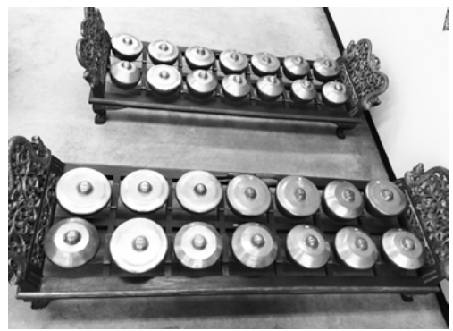
写真②：大きいボナン・バルン（手前）と小さいボナン・パナルス（奥）。2015年1月22日東京音楽大学付属民族音楽研究所にて。