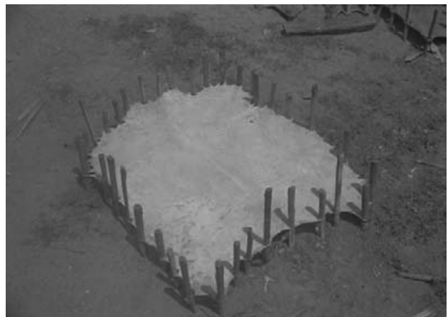
写真4：皮の天日干し

現在、タブラーの胴に使用される木材には、コイル khair(学名 Acacia catechu )、ニーム nīm(学名 Azadiracta indica )、およびシーシャム śīśam(学名 Dalbergia sisoo 17 )、マホガニー(学名 Swietenia mahogany 18 )などがある。コイルが一番良いとされるが、コルカタで大規模に楽器商を営むM氏も今までにコイルの胴を見たことはまれだとのことである 19 。伐採に制限が加えられているとのことである 20 。一般的には、ニームが使われる。