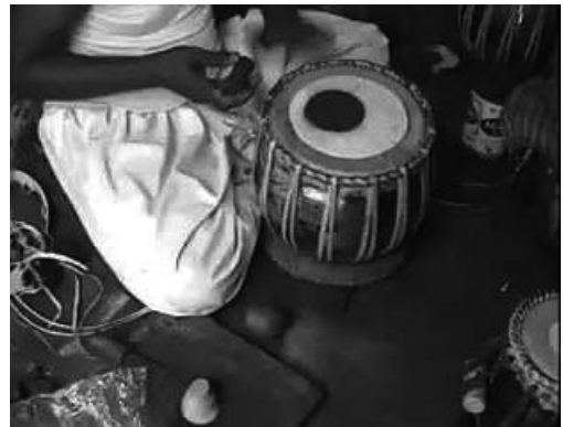
動画3：ジャワーリー付け

一般に用語ジャワーリー javārī はスィタール sitār など弦鳴楽器に適用するが、膜鳴楽器にも使用することは興味深い。楽器の発音体振動から生じる音を人工的に加工する例は、アフリカの各種ザイロフォンの共鳴器や中国の笛子など数多く存在する。薄膜を利用することが多いため、ミルリトン膜と言われる。ただ音色加工メカニズムは、膜ばかりではない。日本の三味線のさわりやスィタールのように、物体と振動弦の接触により音色にビーンという響きが追加される。この例も広義のミルリトンに入れば、インドの膜鳴楽器のシャーヒーもミルリトンと言えるだろう。ジャワーリーを適切に施したタブラーの方が、「良い」音だとされているが、ジャワーリー作業なしのシャーヒーと、ジャワーリー作業ありの鼓膜について、音響分析を行うべきであろう。動画3に、バーヤーンのシャーヒー表面を木製すり具で整え、石製すり具で作業するジャワーリー付け工程を示した。後半で、太鼓の音高が低く深くなることわかるだろう。