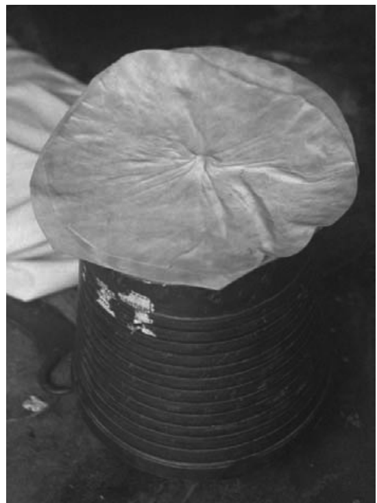
写真10：下処理後の革2枚

革の処理はまず、表面の余分な組織や毛を丁寧に除去することから始まる。水をかけながら細かく作業を進める。川上工程のなめしにおいてもある程度の清掃をしてあるものの、楽器に使用するためには、汚れを除去するとともに革を適当な厚みに整え、さらに均質性を高める必要があるのだと思われる。処理作業中も随時に水をかけて、革が乾燥しないように注意を払う。また、次の工程まで短時間の保管が必要になる場合も、水の中に浸して乾燥を防ぐ（写真10 24 ）。