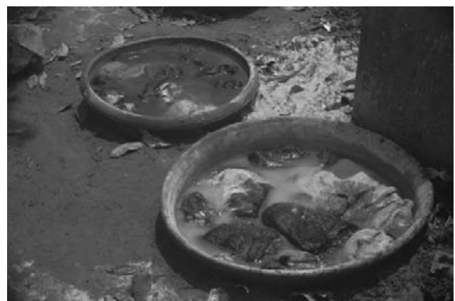
写真2：石灰水溶液での皮のなめし工程