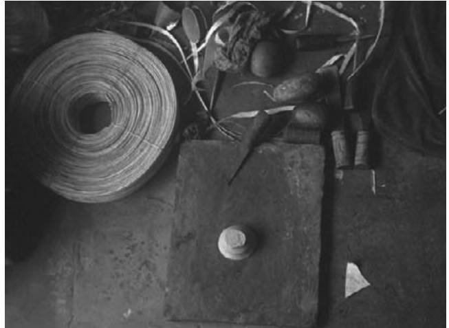
写真11：製作用の道具類

動画2 29 に、鉄粉と米飯その他の材料の混合と、バーヤーンの鼓膜へシャーヒー材を塗布する過程を示した。この工程で職人は、常に音を出して確認しながら作業を進めている。大事なことは実際に出る音を良くすることである。シャーヒーの仕上げ時のサイズと位置は、