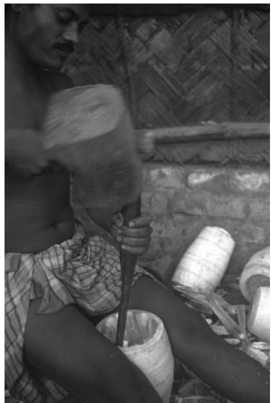
写真5：タブラー胴の製作

よく乾燥させた丸太状の木材を、タブラーの胴を削り出しに適した大きさに荒く切り、外側から胴体の形を削り出す。現在では電動式回転台に固定して、刃物を当てて削り出す。その後、底を残して内部をくり抜く(写真5 21 )。始めに電動式ドリルを使い荒削りをした後、のみを使い削っていく。胴高は約25cm、上端の外径は約12.5cmであった。Dickは、コルカタスタイルのタブラーは小ぶり(上端径=13cm)、ムンバイスタイルのものは大ぶり(同=14cm)と分類する。また古いタブラーでは、パカーワジの右鼓膜と同程度、つまり16.5cmまたはこれ以上のものがあると述べている[DICK 1997: 494]。