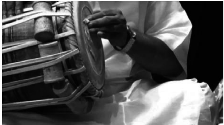
動画4：パカーワジの調律（左手）

本稿では、まずインドの太鼓製作技術や「わざ」を考察するに当たり、古代インド音楽の基本文献NSの記述を確認した。その上で、コルカタのタブラー・バーヤーン製作のフィールドワークの知見をまとめた。次に解明できた点、今後の課題などをまとめる。