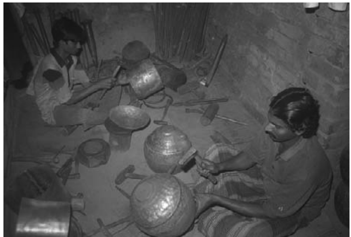
写真7：バーヤーン胴の成形