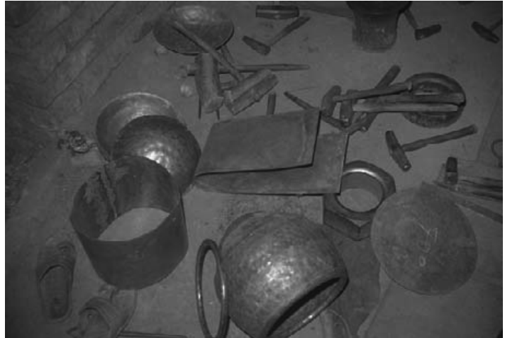
写真6：バーヤーン胴の材料

写真7に、側板の加工(写真中央奥)、底板と側板の結合後の鍛造工程を示した。焼き入れ後に仕上げとしてメッキをかけて、美しく輝く胴体が完成する(写真8)。訪問した金属加工業者は、楽器用部品だけを手がけるのではない。彼らの主な製品は、パン焼き用器具タワー tavā や、金属製であることが多い皿、ターリー thali などの調理器具である。