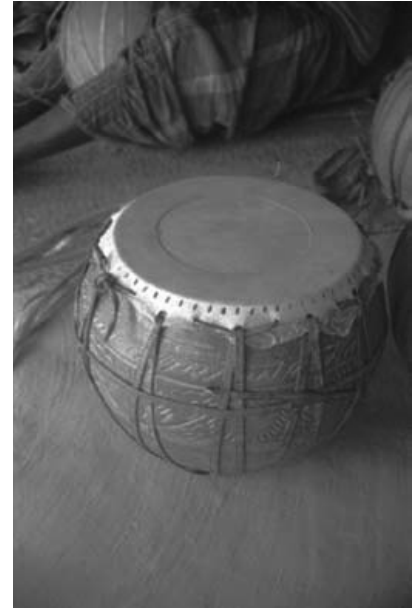
写真1：土器のバーヤーン (製作途中)

タブラーの場合もバーヤーンの場合も、鼓膜はヤギ革2枚で構成される。タブラーの場合には、内側へさらに牛革1枚を追加して、柔らかいヤギ革が調音の際に摩耗することを防いでいる。生のヤギ皮は、屠殺後4～5日間水中に浸した後、石灰水溶液に同期間保存