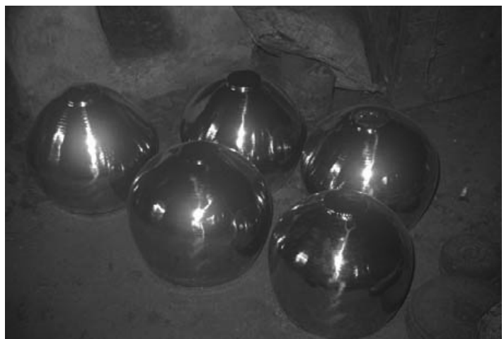
写真8：メッキ後のバーヤーン胴