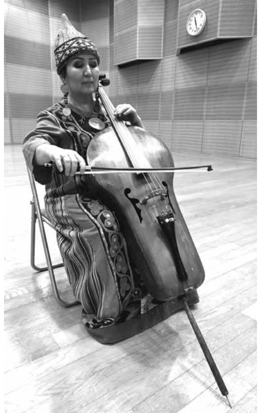
【写真 6】改良型バス クヤク