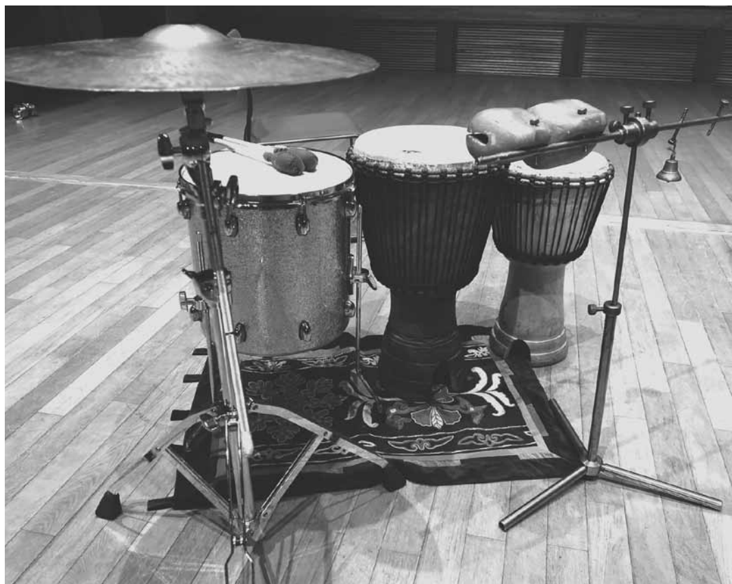
【写真 12】 打楽器

オールド サフナが使用した打楽器は、二台のジャンベ、ドラムセットのフロアタム、クラッシュシンバル、トルコのダラブッカ、鈴とウッドブロックである。