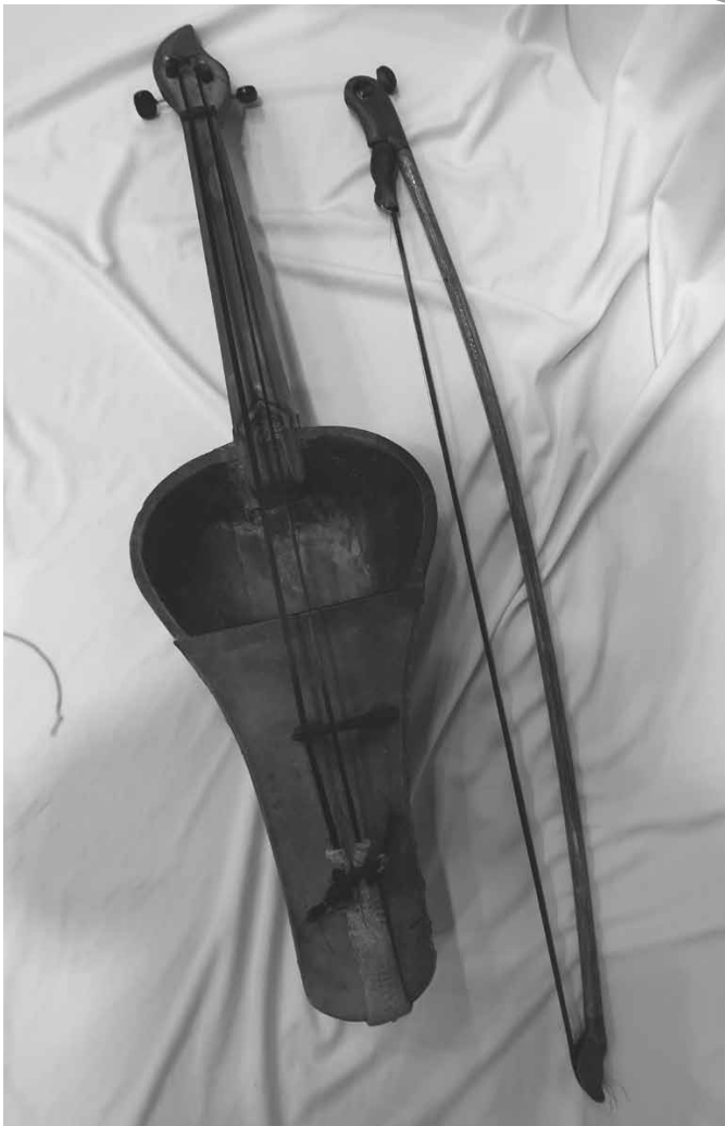
【写真3】二弦の伝統型クルクヤク