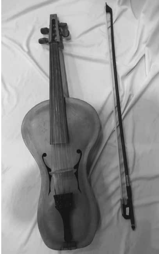
【写真 5】四弦の改良型アルト クヤク