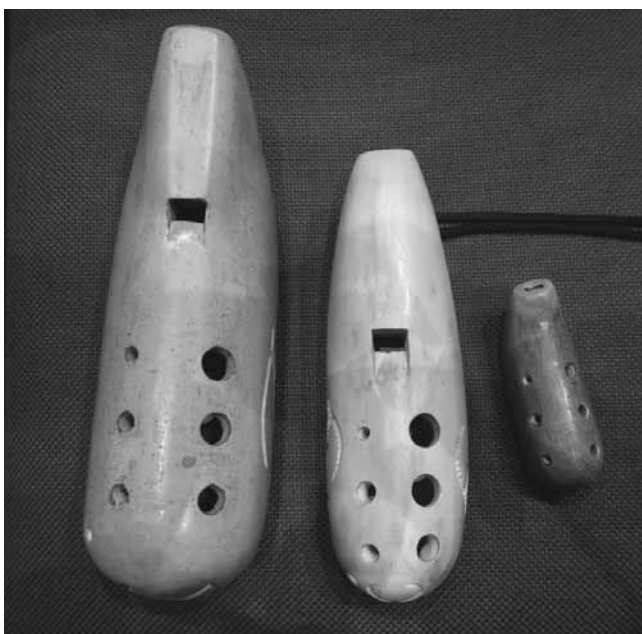
【写真9】チョポ チョール

チョポ チョールは粘土で作られており、丸い形をしたオカリナのようなものである。楽器の名称の「チョポ」は粘土で、「チョール」は笛を意味する。先行研究によれば、かつてチョポ チョールは二つの指孔しかないためレパートリーは簡単で、短いメロディーしか演奏することができず、子供の玩具として扱われていたという 8 。また、視界がはっきりしないとき、例えば牧場で霧がかかったときなど、牧人はチョポ チョールを吹き、自分の位置を知らせるシグナルとして使用したという 9 。以下の【写真9】に写っているチョポ チョールは「オールドサフナ」が使っていた楽器である。