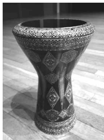
【写真 14】 トルコのダラブッカ