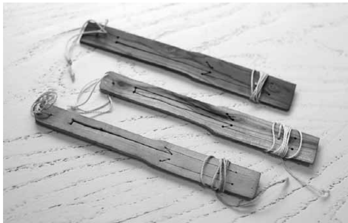
【写真 7】ジガーチ オーズ コムズ

テ米尔 コムズとジガーチ オーズ コムズとは日本語で口琴と呼ばれる小さな楽器である。テ米尔 コムズは金属製で、ジガーチ オーズ コムズは木製の口琴である。