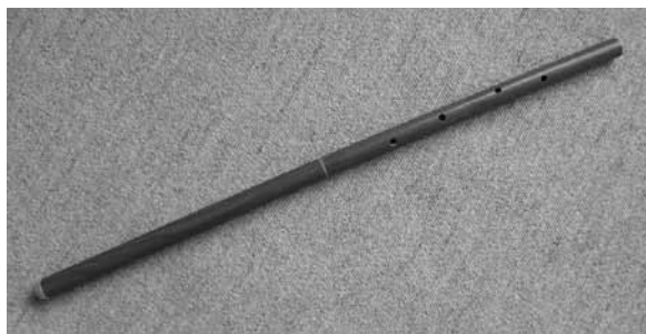
【写真 10】 チョール

チョールには穴が四つあり、叙事詩や民話の中では、クーライ куурай と表記されている場合がある。楽器の素材と構造でチョールが分類される方法もある 11 。クルグズのチョールは縦笛であり、バシキール人 12 とタタール人 13 のクライ курай、カザフ人のスブズグ сыбызгы と類似する。