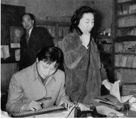
図4 算盤をはじく水の江瀧子（「私はプロデューサー」『サンケイグラフ』1955年3月13日号, 11.）

スターの素質のひとつは、やはり輝く美しさのなかに、どこか抜けたところ、欠点があることだと思うんです。裕ちゃんにしても決して完璧な紅顔の美少年じゃなかったでしょ。それが逆に親しみやすさ、庶民性につながってる」（水の江 1984:126）と述べている。映画監督の井上梅次もまた、「裕次郎の歌は素人芸」であるが、だからこそ大衆は「あの歌なら俺だって唄える」と親近感を感じたのだと指摘した（井上 1987:33-6）。